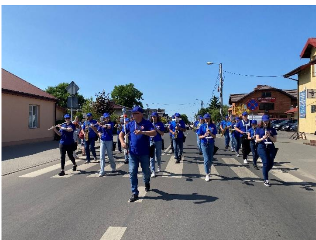
Zdjęcie 42. V Powiatowy Przegląd Orkiestr Dętych w Chodczu.