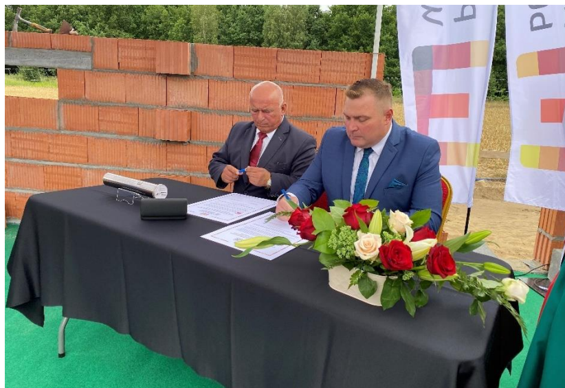
Zdjęcie 32. Podpisanie aktu erekcyjnego pod budowę dwóch placówek opiekuńczo-wychowawczych.