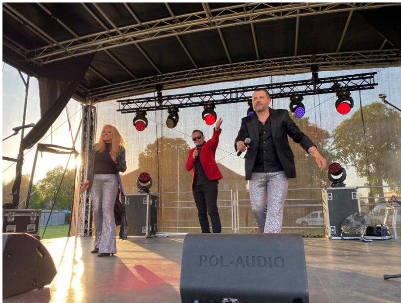
Zdjęcie 31. Występ kabaretu Pod Wyrwigroszem