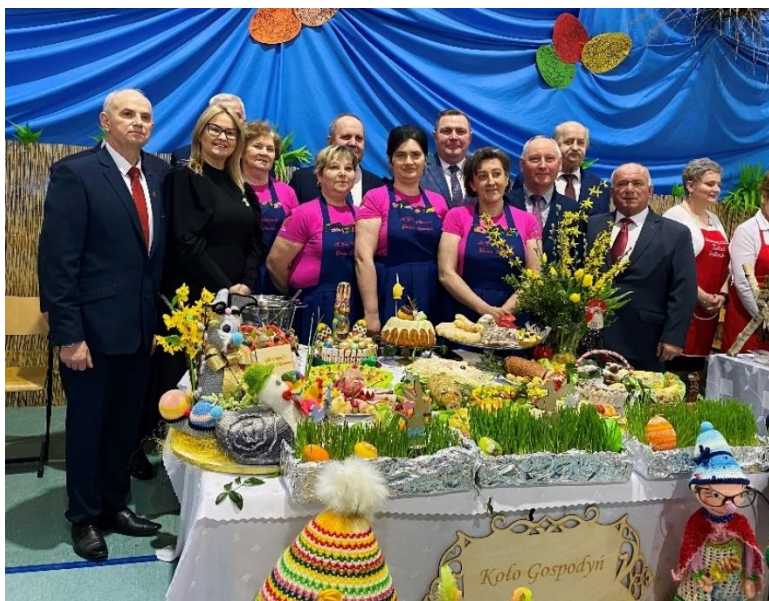
Zdjęcie 30. XIII Powiatowa Wystawa Stołów Wielkanocnych.