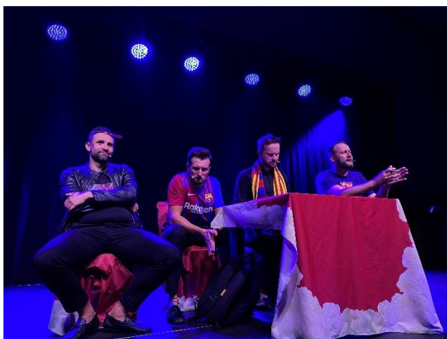
Zdjęcie 11. Występ Kabaretu Skeczów Mężących.