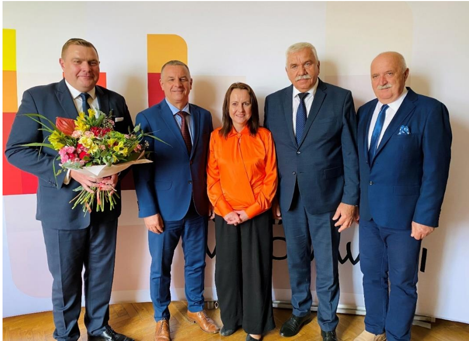
Zdjęcie 2. Rada Powiatu we Włocławku podczas sesji absolutoryjnej w 2023 r.