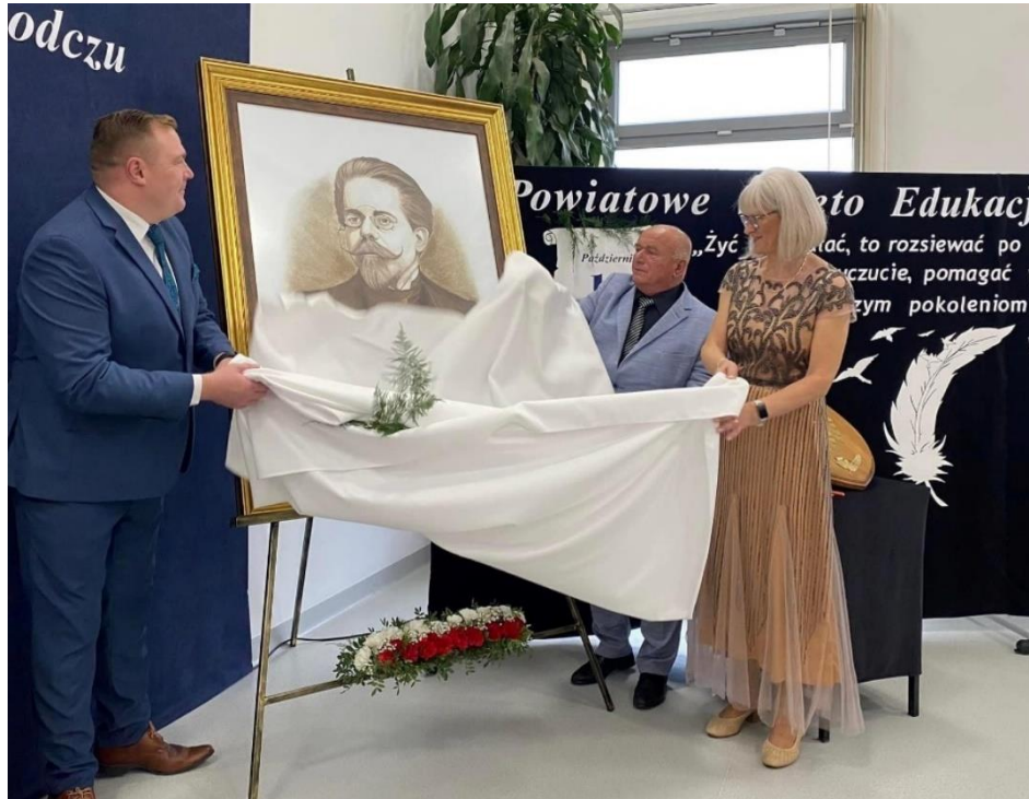
Zdjęcie 25. Uroczystość nadania imienia PCKZiU w Chodczu.