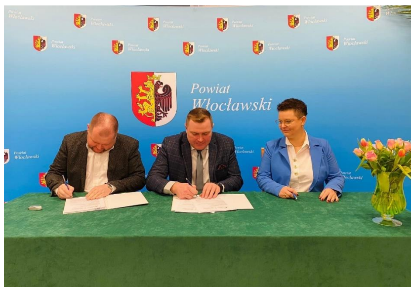
Zdjęcie 16. Podpisanie umowy na zadanie " Budowa nowego boiska wielofunkcyjnego o wymiarach pola gry 20 m x 40 m wraz z zadaszeniem o stałej konstrukcji przy Zespole Szkół im. Marii Grodzickiej w Lubrańcu Marysinie ".