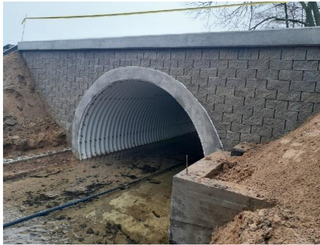
Zdjęcie 10. Przebudowa obiektu mostowego w m. Borzymowice.