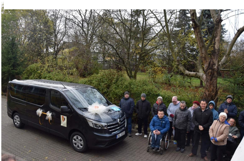
Zdjęcie 26. Uroczyste przekazanie busa dla DPS-u w Kowalu.

W dniu 15 listopada 2023 r. odbyło się uroczyste przekazanie samochodu 9 osobowego przystosowanego do przewozu osób z niepełnosprawnościami dla DPS w Kowalu. Koszt zakupu busa wyniósł 209.000,00 zł, z czego 130 000,00 zł stanowi dofinansowanie z PFRON.