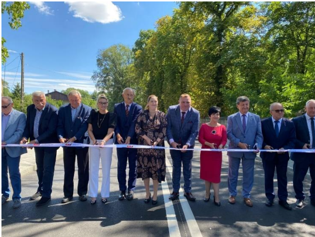
Zdjęcie 9. Odbiór drogi powiatowej nr 2913C Lubraniec - Kruszynek