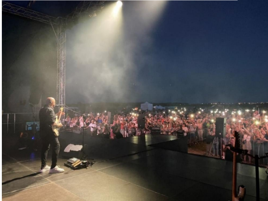
Zdjęcie 33. Występ zespołu KOMBII.

W ramach Święta Powiatu Włocławskiego został zorganizowany Festiwal Smaku , podczas którego Panie z Kół Gospodyń Wiejskich zaprezentowały swoje umiejętności kulinarne. Odbył się konkurs na Najlepszy Smalec Kujawski oraz na Najlepsze Kluski Ziemniaczane z dodatkami. Odbyło się również wspólne gotowanie żuru kujawskiego dla uczestników imprezy. Koszt organizacji Festiwalu Smaku to: 166.832,00 zł.