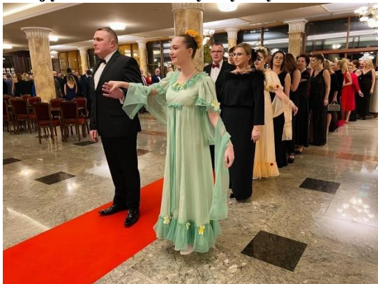
Zdjęcie 28. Bal Charytatywny w 2023 r.