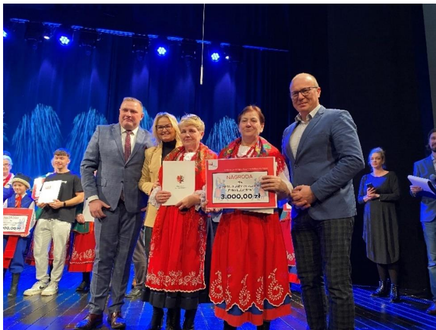
Zdjęcie 38. I Powiatowy Przegląd Zespołów Folklorystycznych.