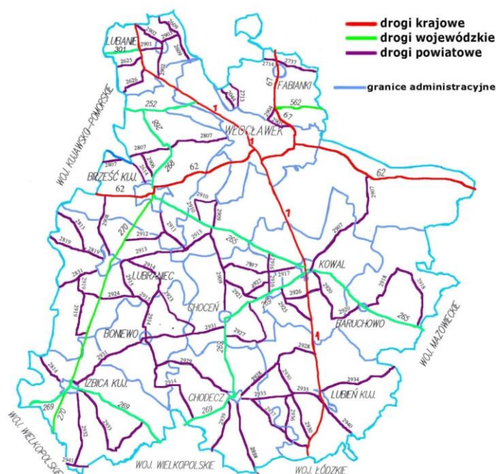
Mapa nr 2 Sieć drogowa w powiecie włocławskim.