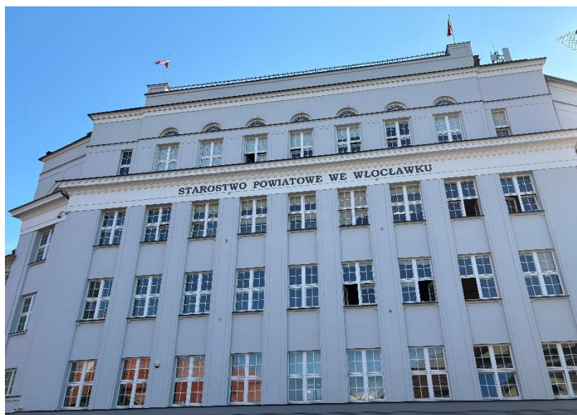
Zdjęcie 13. Budynek Starostwa Powiatowego we Włocławku po remoncie.