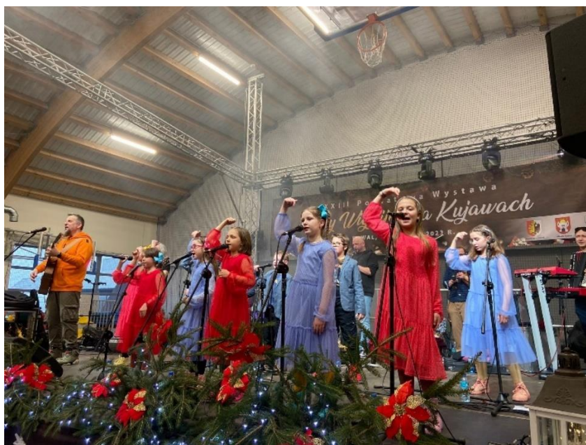
Zdjęcie 39. Występ zespołu ARKA NOEGO.