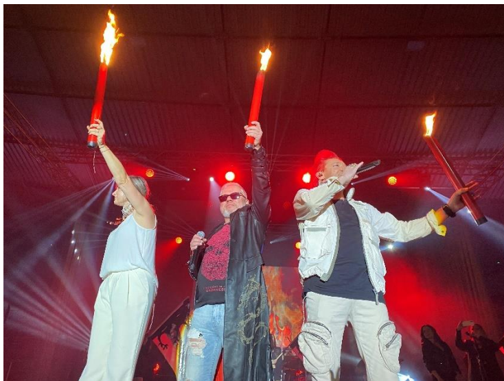
Zdjęcie 29. Występ Zespołu ICH TROJE.